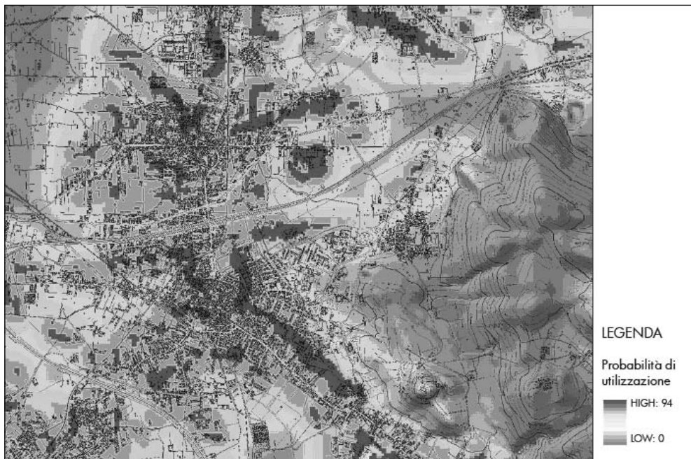
Figura 2 – Esempio di simulazione di scenari di attuazione del piano: Favorevolezza o Propensione del territorio provinciale a trasformarsi in tessuto urbanizzato.

La definizione degli impatti estetici richiede un giudizio su ciò che costituisce un “detrattore di qualità visuale”; tale giudizio è piuttosto complesso e difficilmente standardizzabile, in quanto strettamente dipendente dal contesto in cui si opera. È però generalmente possibile identificare, in ogni contesto, gli elementi incongrui che contribuiscono al degrado visuale del paesaggio. Tali elementi spesso comprendono cave, discariche, manufatti e impianti industriali, edifici di basso valore architettonico ed elevato ingombro, viadotti ed altre infrastrutture visualmente invasive. Un indicatore di impatto è in questo caso ottenibile calcolando per ogni punto del territorio la percentuale di area visibile dal punto in cui risulta occupata da elementi detrattori. Questo si ottiene con funzioni di analisi del modello digitale del terreno implementate, fra gli altri, nei software TAS (Lindsay, 2005) e IDRISI (Eastman, 2001).