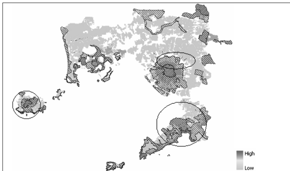
Figura 3 – zone costituenti opportunità in quanto aree destinate al riequilibrio ambientale ove è possibile prevedere misure di conservazione del suolo.